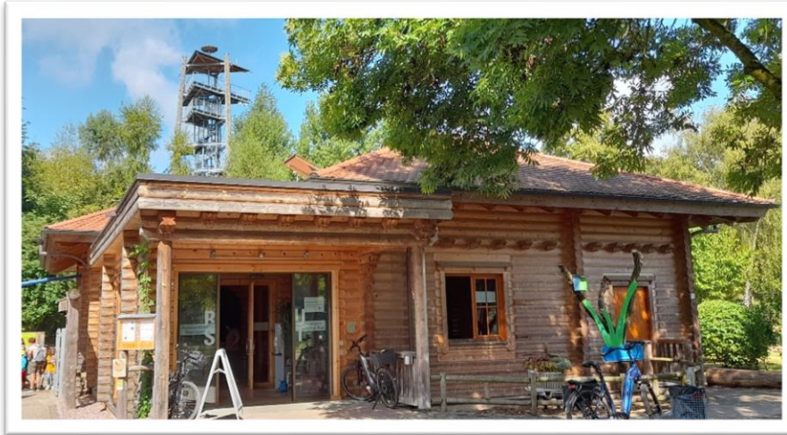
Naturzentrum Rheinauen in Rust, Eintritt 2 €